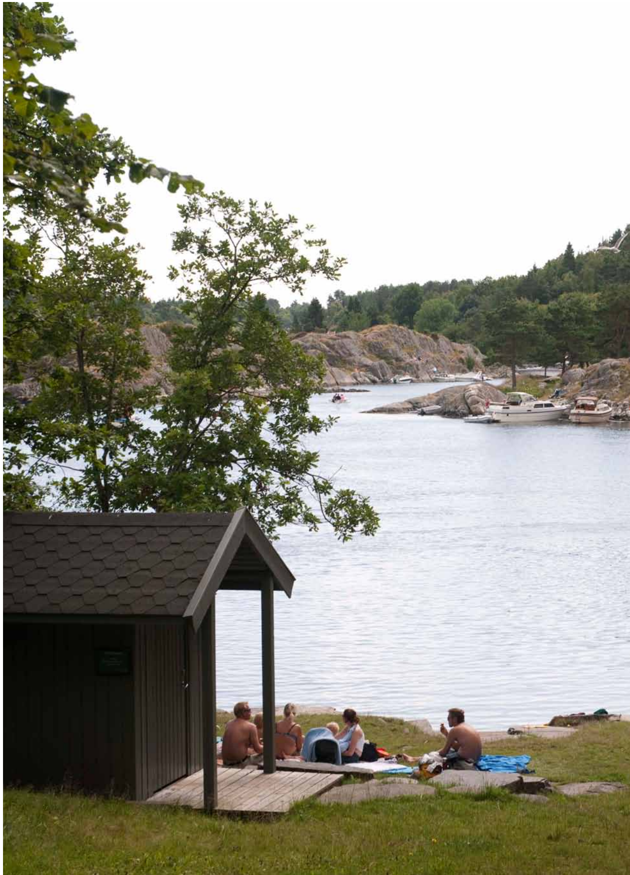
Kommuneplan- bestemmelsen tillater toalett, brygger og turstier til bruk for allmennheten på badeplasser og i turområder ved sjøen.