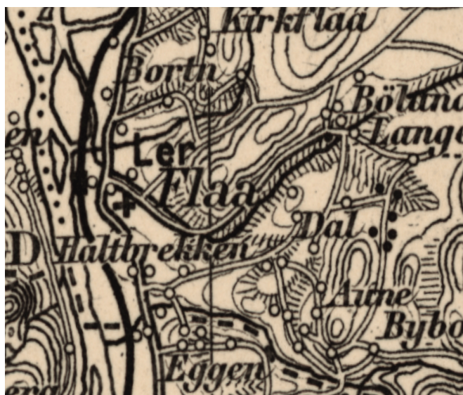
Amtskart - Kartverket med gamle stedsnavn

mune ble delt i to. Fra 1964 ble den igjen en del av Melhus kommune. Kommunen Flå hadde 614 innbyggere ved opprettelsen. Kommunesenteret lå på Ler, som var kommunens eneste tettsted og den ene av tre kretser. De øvrige kretser var Bolland og Dahl. Fra 1. januar 1964 ble Flå, Horg, Hølonda og Melhus (samt en del av Buvik) slått sammen til den nye kommunen Melhus. Flå hadde 843 innbyggere på det tidspunktet.