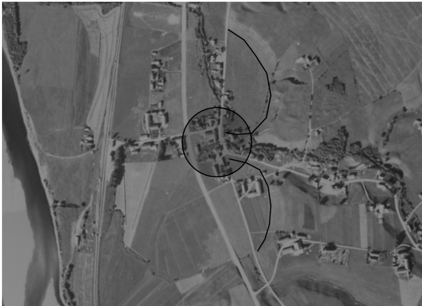
Flyfoto fra 1947 med raster viser tydelig de to halvmånene

i det slakt hellende terrenget. Der disse formene møtes, har Kaldvella funnet løpet sitt ned på elvesletta. Det gamle sentrum ligger i den nordlige halvmåneforma og der de to formene møtes.