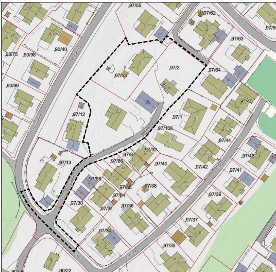
Kart som viser planområdet med stiptet linje (med forbehold om mindre justeringer)

tomannsboliger og/eller boliger i kjede med tilhørende lekeplass og nødvendig infrastruktur. Bebyggelsen er planlagt i inntil to etasjer med sokkel. Eksisterende bebyggelse innenfor planområdet er planlagt revet.