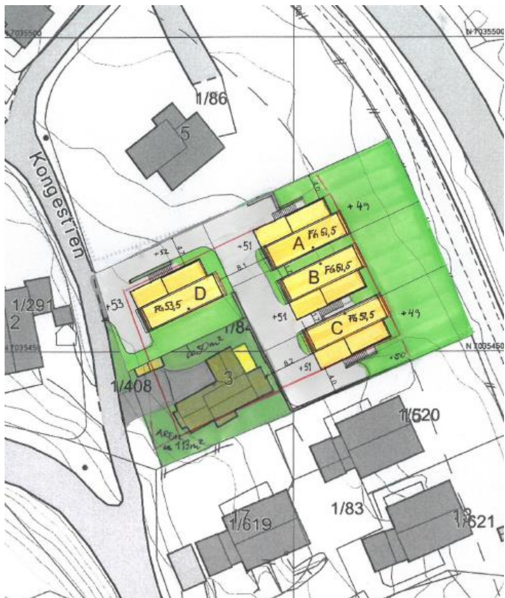
Figur 2 viser foreløpig skisse