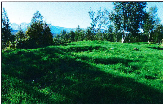
Id 58300-1. Denne gravhaugen består av en resterende voll med åpning mot nord. Bilde tatt mot sørvest.

Den ene gravhaugen fremstår som en hesteskoformet voll med åpning mot NNØ (Id 58300-1). Det ble også sett flere udefinerte forhøyinger og/eller groper på flaten rundt gravhaugen. Det er usikkert om disse strukturene kan ha sammenheng med selve gravhaugen.