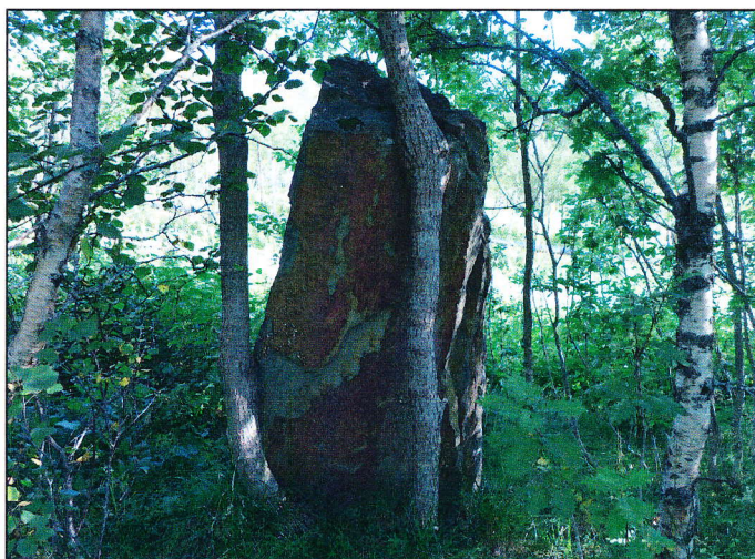
En oppreist stein, trolig sprengt, står på vestsiden av sti/vei ned mot Ekkerelva.

En oppreist stein ble påvist like i veigrøften på vestsiden av sti ned mot Ekkerelva i sør. Steien anses for å være en sprengingstein i forbindelse med veibygging ned mot Ripnes, og tolkes ikke som noen forhistorisk bautastein.