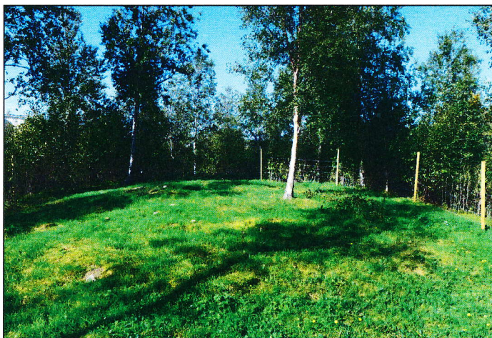
Id 58300-2. Denne gravhaugen er ligger lavt i terrenget og består av en sentralrøys med en tilhørende brem/kant mot nordøst.

De to gravhaugene ble målt inn med GPS som har en nøyaktighet +/- 3 meter. Kartfestingen av disse to gravminnene ble noe endret i Askeladden (den nasjonale databasen for kulturminner).