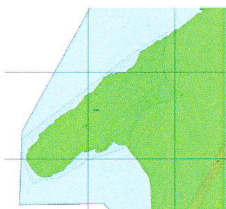
Sonen avmerket på høringskartet.

Salten Naturlag klaget på vedtaket til Områdereguleringsplan Geitvågen - gjort av Bodø Bystyre 29.10.2015.