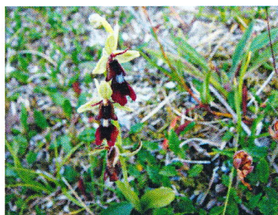
Flueblom funnet under befaring

I sak 16/58 den 12.mai 2016 gjorde Bystyret vedtak om delvis å imøtekomme klagen framsatt av Salten Naturlag: Vedtatt plan foreslås endret ved at plankartet tilføres hensynssone biologisk mangfold . Det knyttes bestemmelser til hensynssonen som ivaretar biologisk mangfold innenfor hensynssonen. Endret plan gis en begrenset høring med påfølgende politisk behandling. Forslag til endring i planen medfører ikke arealbrukskonflikt. Det er bare den del av områdereguleringsplanen som omfatter forslag til ny hensynssone, som ble åpnet for merknader i den begrensede høringen.