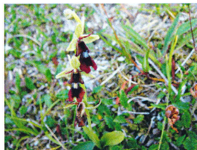
Flueblom funnet under befaring

I sak 16/58 den 12.mai 2016 gjorde Bystyret vedtak om delvis å imøtekomme klagen framsatt av Salten Naturlag: Vedtatt plan foreslås endret ved at plankartet tilføres hensynssone biologisk mangfold . Det knyttes bestemmelser til hensynssonen som ivaretar biologisk mangfold innenfor hensynssonen. Endret plan gis en begrenset høring med påfølgende politisk behandling. Forslag til endring i planen medfører ikke arealbrukskonflikt. Det er bare den del av områderegeringsplanen som omfatter forslag til ny hensynssone, som ble åpnet for merknader i den begrensede høringen.