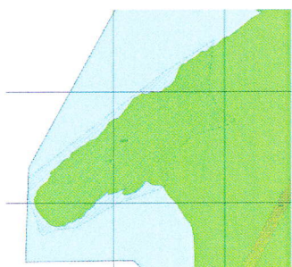
Sonen avmerket på høringskartet.

Salten Naturlag klaget på vedtaket til Områderegeringsplan Geitvågen - gjort av Bodø Bystyre 29.10.2015.