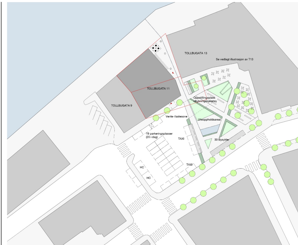
Skisse på situasjonsplan