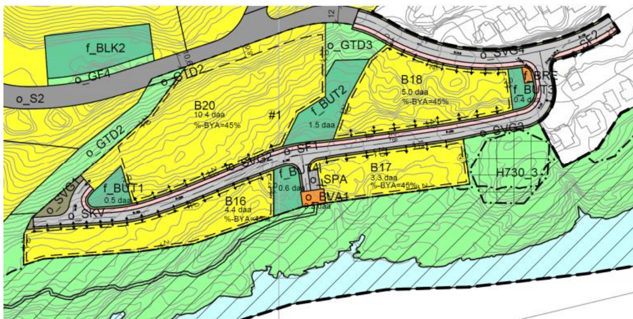
Utsnitt av plankart – bestemmelsesområde #

Det vises til at det aktuelle området er bratt og stiger mot nordvest, og at hvis det ikke blir brukt til omsøkt tiltak, vil det framstå som en fjellskjæring og dermed være lite tilgjengelig for faktisk bruk. Dersom det omsøkte tiltak tillates vil fjellet sprenges bort ved at fjellkonturen flyttes bakover hvorpå skjæringen sikres med gjerde.