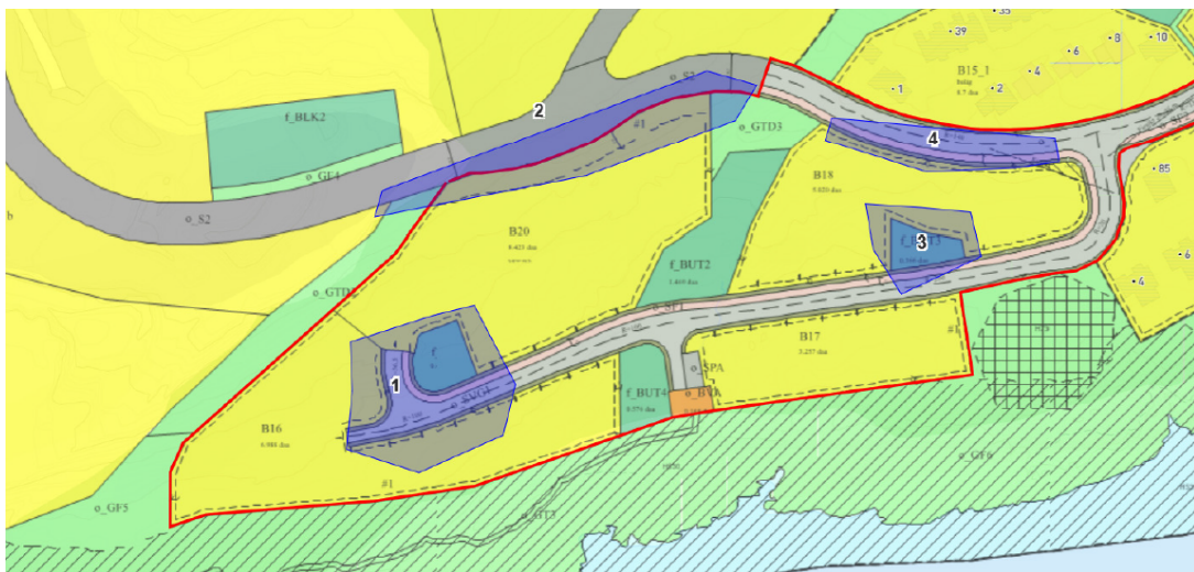
Foreslåtte endringer i plankartet