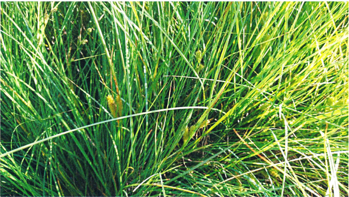
Flaskestarr dominerer ved vannpølen.