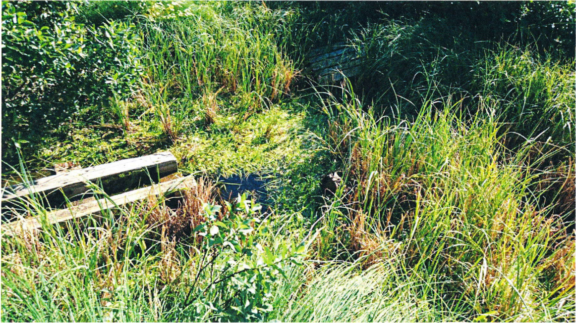
Dam. Lite vann.