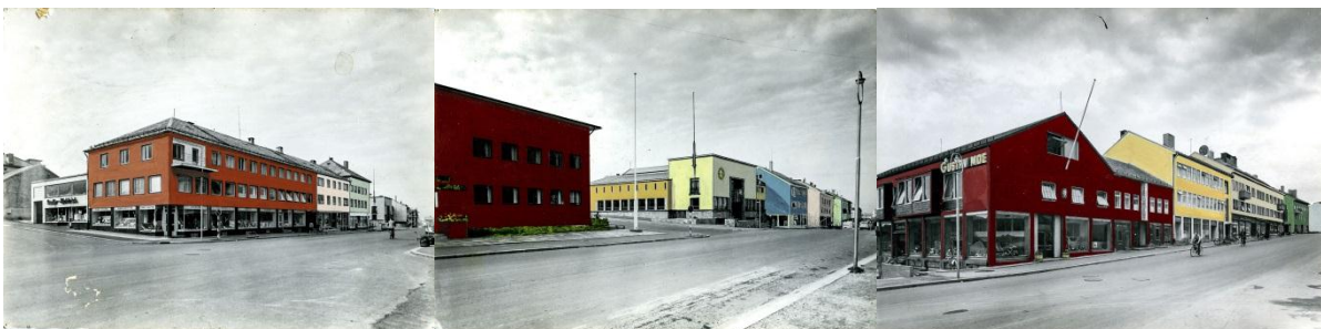
Figur 1. Eksempel på fargeplan. Håndkolorerte svartvitt fotos av eldre dato.

Kilmaskjerming av gaten kan også organiseres som en designkonkurranse. Det viktigste er å få et enhetlig preg som ikke skjemmer arkitekturen, men som fremhever og understreker dens kvaliteter.