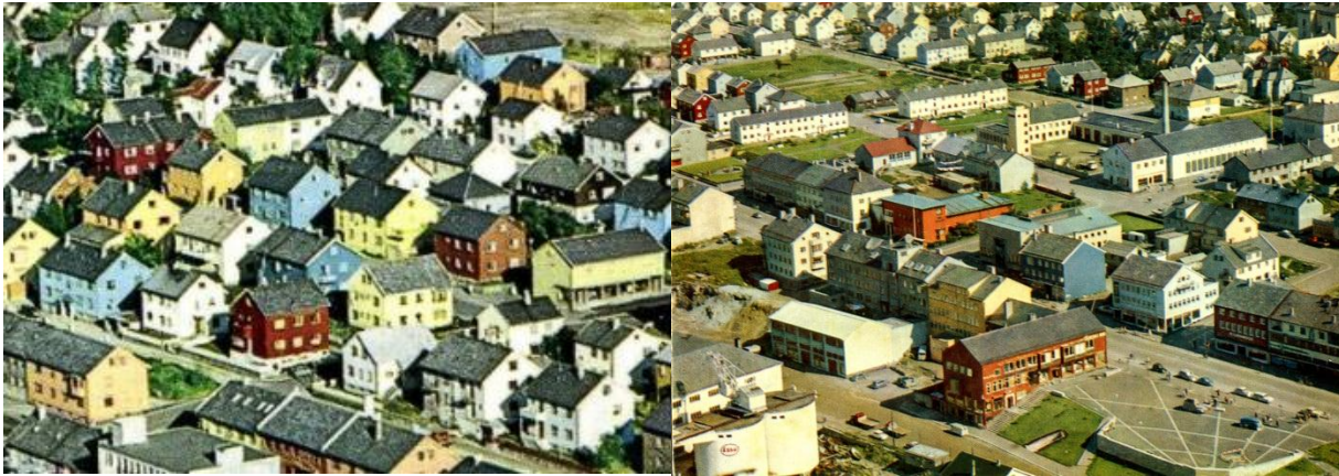
Figur 2. Eksempel på typisk fargepalett for gjenreisningsarkitekturen.