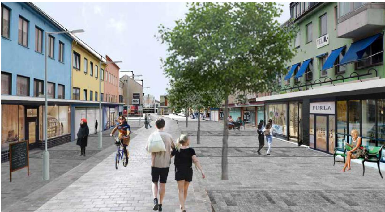
Figur 3. Illustrasjon fra rapporten «Utvikling av Bodø sentrum» av studentene K. Hylin og C. Åsenberg, 2014. Denne viser et eksempel på hvordan fasadene kommer bedre frem med en forenkling av utforming på baldakinene