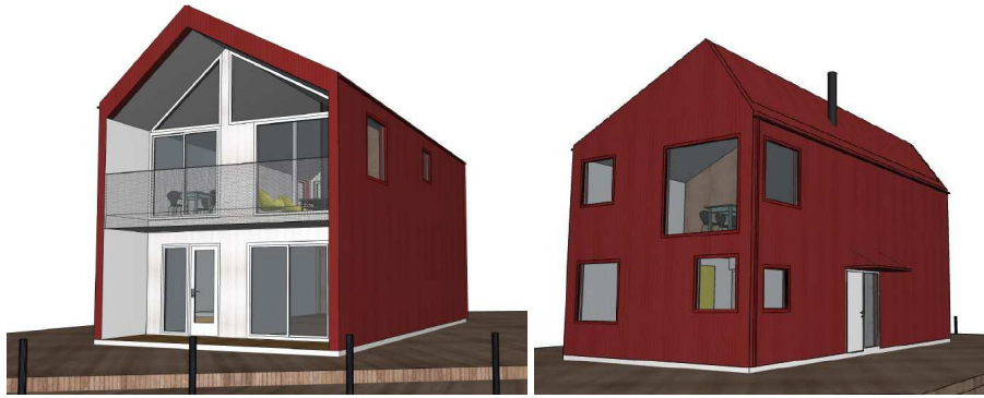
Figur 2. Forslag ny fasade