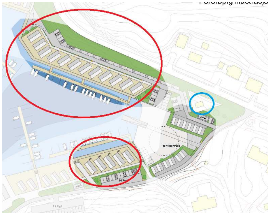
Figur 1. Områder som vil bygges ut (vist med rød farge) og område der formålendring ønskes (vist med blå farge)