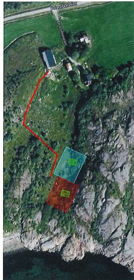
Figur 2; plassering av tomt med hytte.

Hestmann/Strandtindene har ikke kommet med en uttalelse.