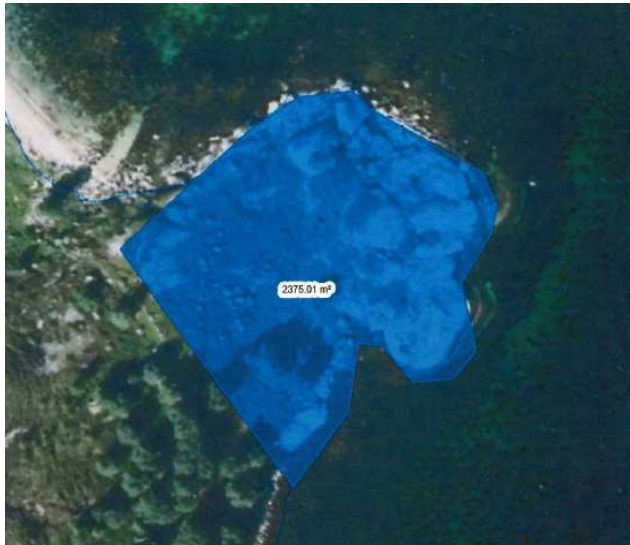
Figur 2. Detaljkart – søknad om fradeling av tomt til båtplass, gnr. 24/1

Kjøper av tomta, Stein Sjursen, ønsker å bygge et naust, kai og kaihus som vist i kartskisse nedenfor.