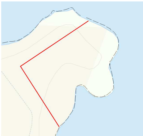
Figur 5. Mulighet for å redusere tomtestørrelse

Blant annet for å imøtekomme innspill fra lokalutvalget og fylkesmannen har vi sett på mulighet å redusere størrelse på tomta, slik som vist med rød strek i kartskisse nedenfor.