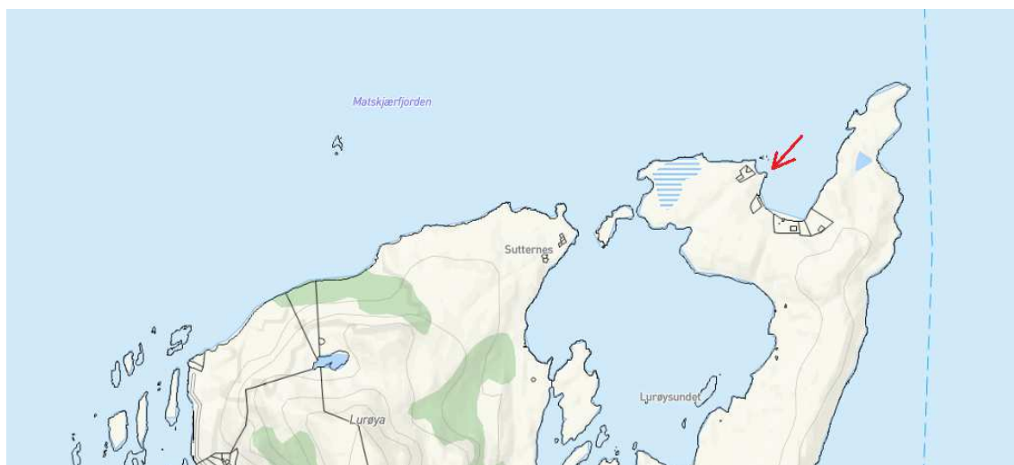
Figur 1. Oversiktskart – søknad om fradeling av tomt til båt plass, gnr. 24/1

Lurøy kommune har mottatt søknad om fradeling av tomt for båt plass fra Sameie Lurøysund (4 medeiere som eier \frac{1}{4} del av gnr. 24/1 hver) representert av medeier Elin Norum Holmen. Kjøper av tomta er Stein Sjursen som bor og har registrert adresse på eiendom gnr. 24/15 ved siden av stedet der det søkes om fradeling av tomt. Ved søknaden følger dispensasjonssøknad og kart. Søker ønsker å fradele en tomt på 2375 m 2 som vist i kartskisser nedenfor.