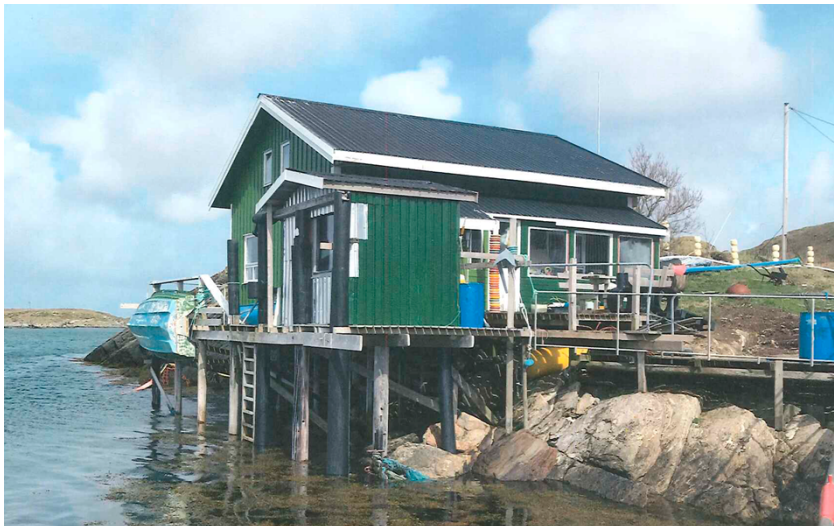
Figur 3. Utseende av naustet. Bilde tatt i fra søknaden

I søknaden er det bilder som viser hvordan naustet ser ut. Hele søknaden følger vedlegg.