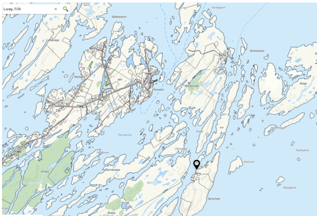
Figur 1. Oversiktskart

Lurøy kommune har fått søknad om dispensasjon/bruksendring for omdisponering av eksisterende naust til rorbu. Naustet ligger på Sørsolvær.