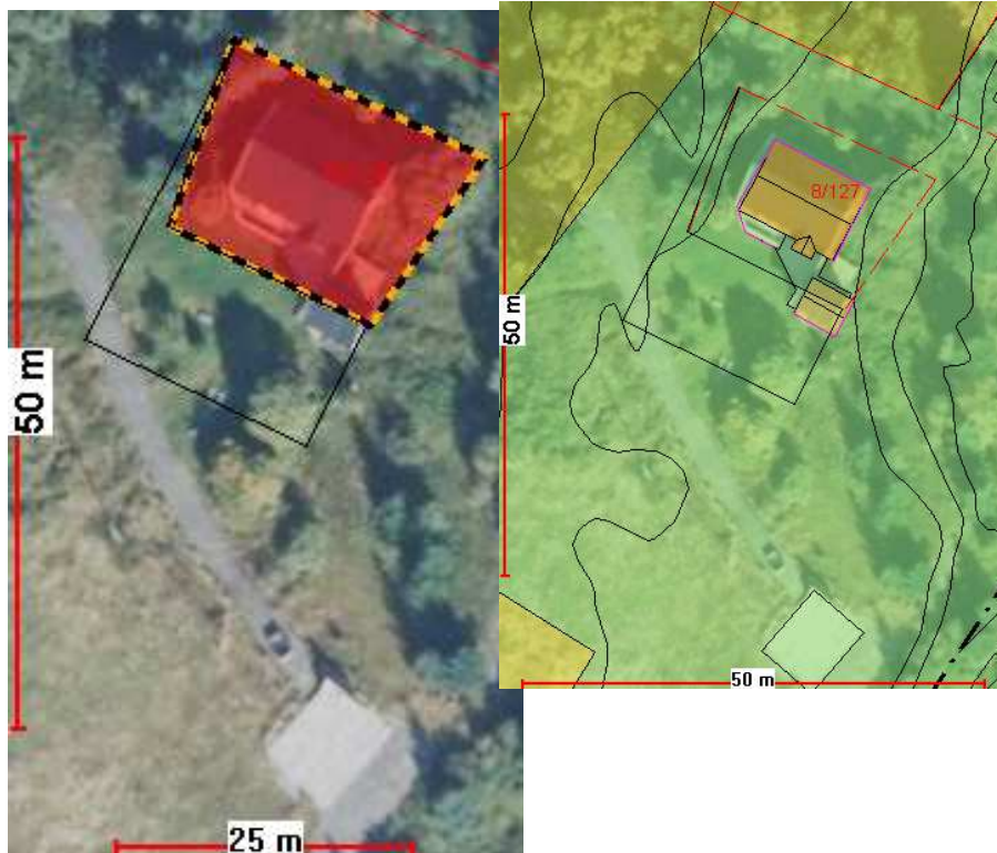
Figur 1, kartutsnitt med omsøkt tomt merket sort strek.