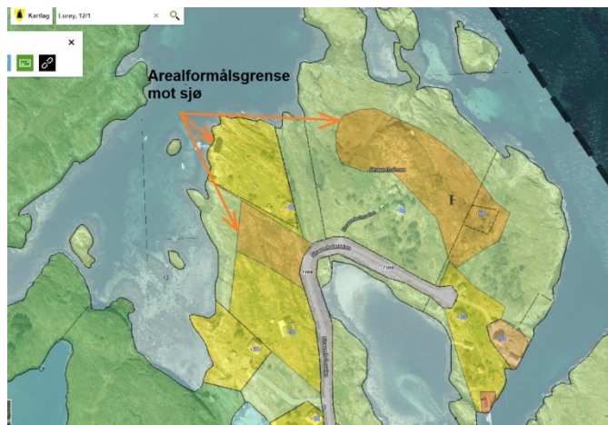
Figur 1. Utdrag fra plankart kommunedelplan Sleneset. Arealformålsgrense mot sjø

Nylig ble det behandlet søknad om dispensasjon for fradeling av boligtomt i strandsone på Sleneset. Tomta skulle fradeles delvis på boligformål, delvis på naustformål og delvis på LNFR formål. Verken naustformål eller LNFR gir hjemmel til fradeling av areal for boligbebyggelse, derfor måtte søknaden behandles som dispensasjon. Under høring av søknaden med Statsforvalteren i Nordland kom det opp at i kommunedelplan Sleneset mangler det en konkret definert forbudsgrense mot sjø. Det heter i uttalelsen fra Statsforvalteren i Nordland.