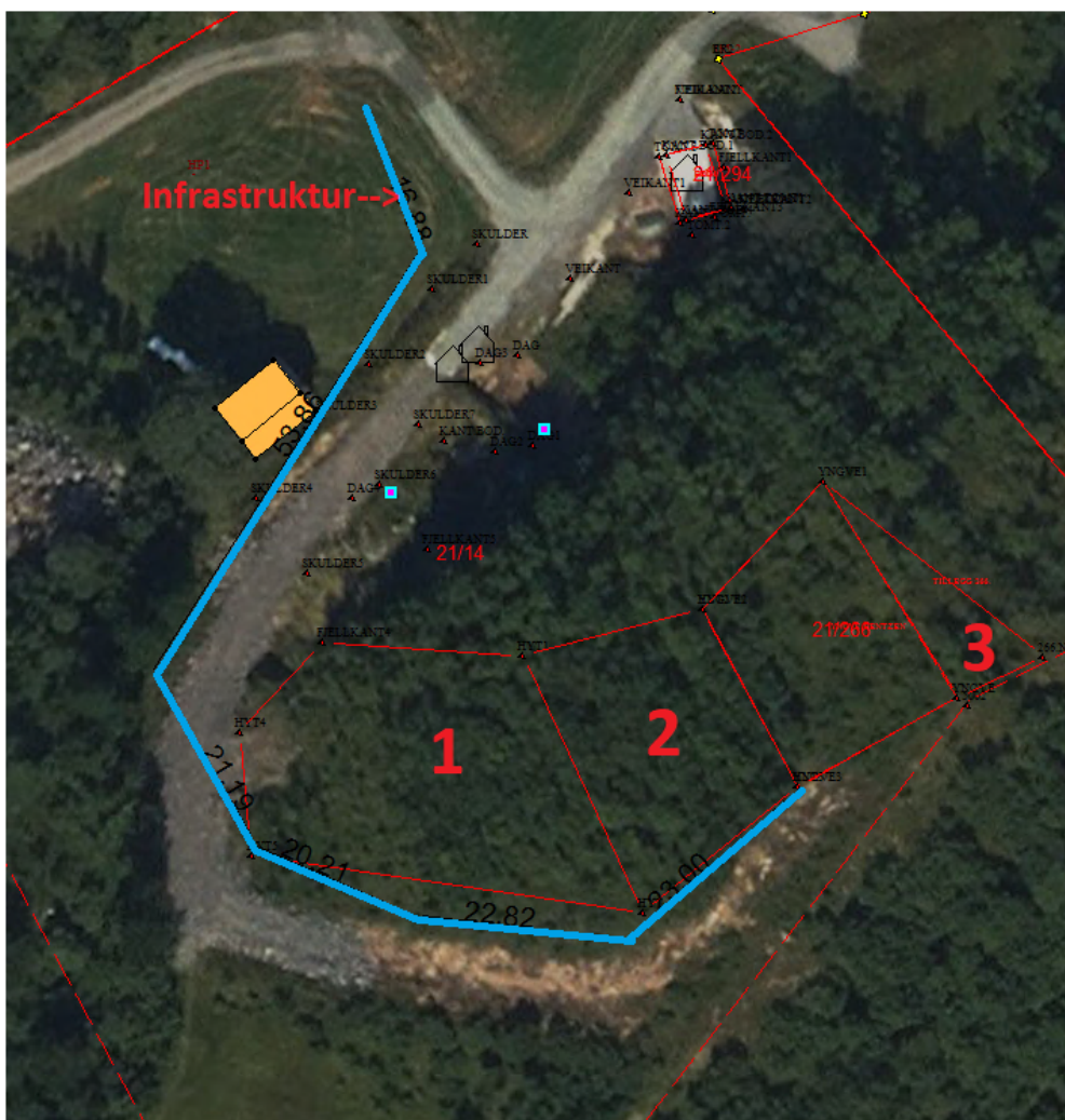
Figur 1 Kartutsnitt med hyttetomter og tegnet trasé for infrastruktur i henhold til søknad.

Vedlagt søknaden er det lagt ved planer for vann- og avløp. Etter søknad skal vann- og avløpsledninger følge veigrøft for så tilknyttes nytt avløpsnett ut i sjø. Det gjøres videre oppmerksom på at avløp skal ligge 2m under laveste lavvann.