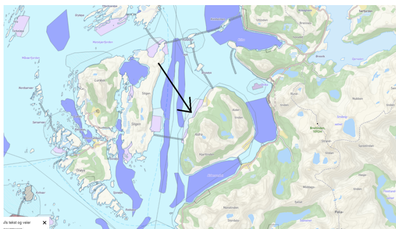
Figur 1. Oversiktskart

Det ble oppdaget en unøyaktighet i Kystplan Lurøy. Det gjelder manglende utvidelse av akvakulturformål i samsvar med planlagt utvidelse av akvakulturlokalitet Ørnes under utlegging av planforslag ut på 3. gangs offentlig ettersyn i slutten av 2018. Kystplan Lurøy ble vedtatt april 2019 uten at feilen ble oppdaget.