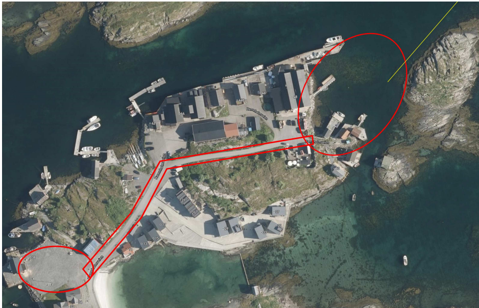
Figur 2. Område for den midlertidige moloen, kommunal vei og område for levering av masse.