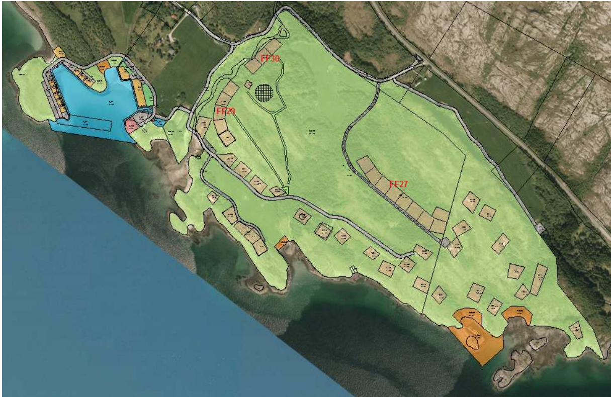
Reguleringsplankart Selnes havn og Varpen hytteområde vedtatt den 11.12.2013

Reguleringsplan Selnes havn og Varpen hytteområde ble vedtatt den 11.12.2013. Mindre deler av planen er allerede gjennomført. Imidlertid, har det vist seg at det er vanskelig å bygge ut hytteområder FF27, FF29 og FF30 som ligger i skoglendt område med vanskelig terreng. Det er også problemer med å føre infrastruktur til disse områdene. Tiltakshaver ønsker derfor å fremme en reguleringsendring.