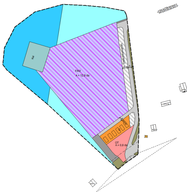
Figur 2. Forslag til endring av reguleringsplan Aldersund næringsområde

Det ble utarbeidet forslag til endring reguleringsplan som ble lagt til behandling i Lurøy formannskap som planutvalg i møte den 16.06.2021.