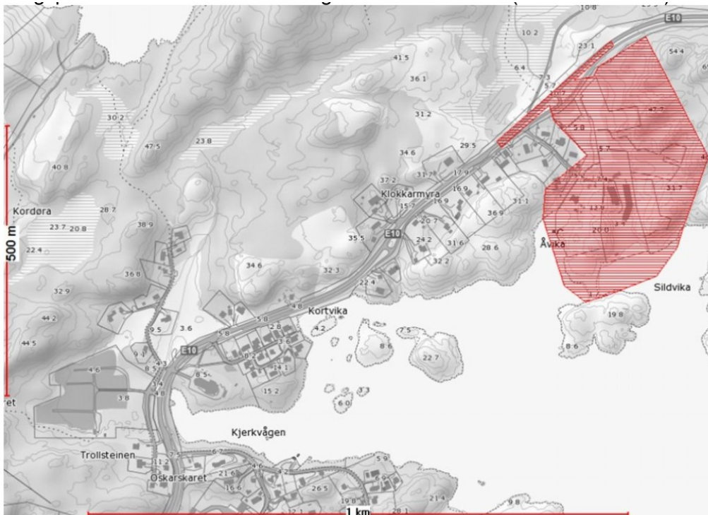
Oversiktskart, SK Norgeskart, gråtone, planområde skravert med rødt, 26.08.2016

Endringsforslag er gjengitt med dokid.1413188. gjeldende plankart og bestemmelser følger saken med dokid.1413189 og 1413190.