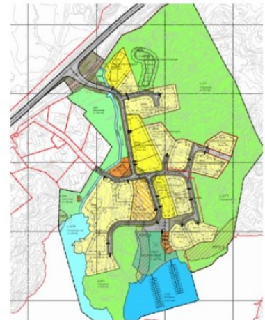
Forslag til ny plan