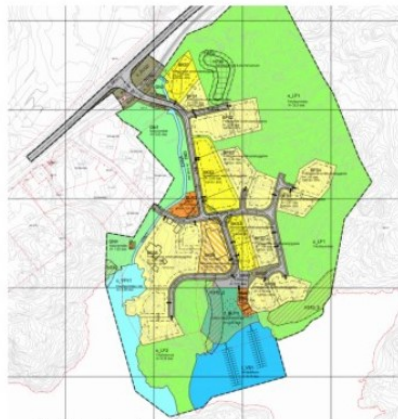
Gjeldende plan av 14.11.16