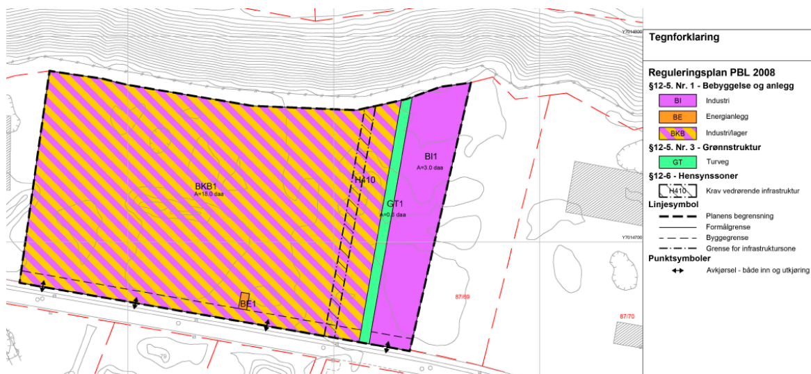
Forslag til nytt plankart.