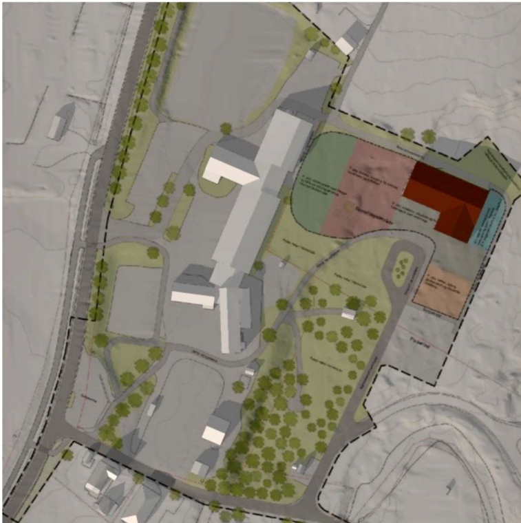
Bilde 3: Vårjevndøgn 20. Mars kl. 15.00