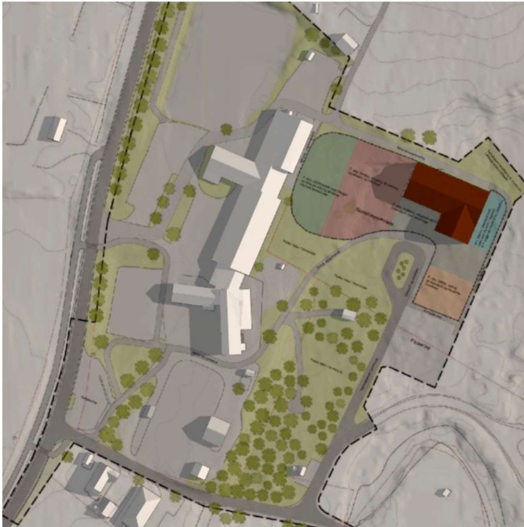
Bilde 5: Sommersolverv 21. Juni kl. 08.00