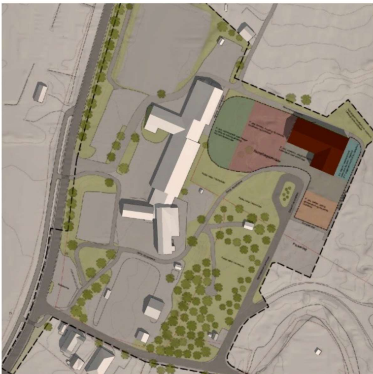
Bilde 6: Sommersolverv 21. Juni kl. 12.00