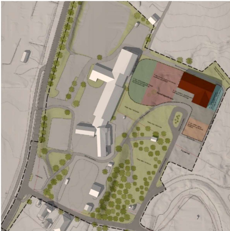
Bilde 7: Sommersolhverv 21. Juni kl. 16.00