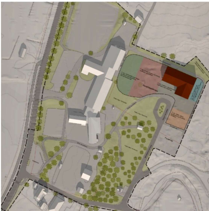
Bilde 2: Vårjevndøgn 20. Mars kl. 12.00