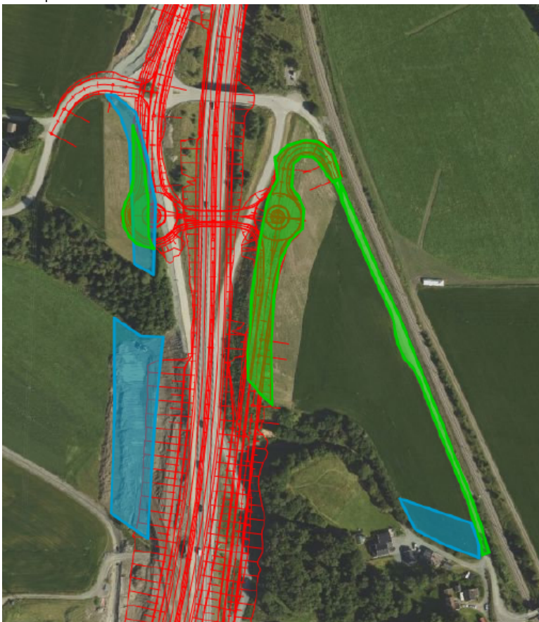
Figur 3 viser teknisk tegning av bruløsning. Grønt viser arealbeslag for bruløsning, mens blått viser arealbeslag for kulvertløsning.

For å kunne innvilge dispensasjon kan ikke tiltaket tilsidesette hensynet bak bestemmelsen det dispenseres fra vesentlig, samt at fordelene skal være klart større enn ulempene. Hensynet bak LNF er i dette tilfellet å ivareta hensynet til jordressursene. Rådmannen vurderer det som positivt at omsøkt løsning bidrar til et mindre arealbeslag på ca. 1 daa for jordbruksareal, sammenlignet med kulvertløsning. En adkomstveg langs med jernbanen vil videreføre dagens situasjon, og dermed unngå nytt inngrep i en skogbevokst bekkedal som også er av betydning i jordbrukslandskapet. Statsforvalteren uttaler i sin endelige høringsuttalelse at de ikke kan se at en oppdyrking vil gi arronderingsmessige fordeler, og har med den bakgrunn ingen avgjørende innvendinger i saken. Det vurderes til at omsøkte tiltak ikke vil tilsidesette hensynet bak LNF-formålet vesentlig, da det samlet bidrar til mindre bruk av dyrkajord. Det vurderes til å være en fordel med tiltaket at man unngår beslag av dyrkajord, som av grunneier er vurdert til å være av bedre kvalitet. Rådmannen vurderer det dithen at det er fordelaktig å benytte eksisterende infrastruktur, fremfor å benytte uberørt landbruksareal til ny infrastruktur. Samlet sett vurderes en bruløsning, som vist i figur 3, til å ivareta hensynet til jordressursene på en bedre måte, og at fordelene er klart større enn ulempene.