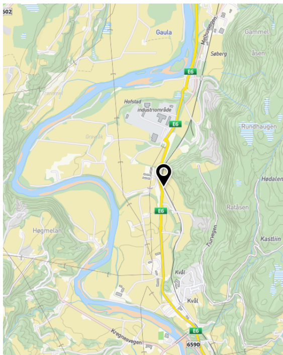
Figur 1 Svart markør viser området hvor det søkes om dispensasjon ved Skjerdingsstad.

Søknad om dispensasjon ble sendt på høring til regionale myndigheter 24.06.20. Med bakgrunn i uttalelse fra Statsforvalteren ble det behov for å utarbeide ytterligere dokumentasjon ved et arealregnskap for tiltaket. Arealregnskap ble oversendt for uttalelse 26.02.21.