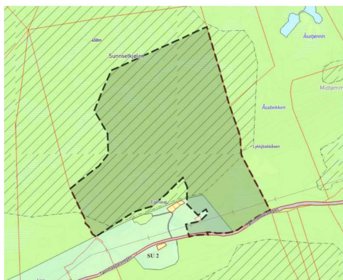
Figur 4 viser gjeldende plansituasjon i området, med planavgrensning vist med svart stiplet linje.

Planområdet er i kommuneplanens arealdel, vedtatt 16.12.14, avsatt til LNF og område for spredt boligbygging (SU2). Planområdet berører i tillegg hensynssone for bevaring naturmiljø. Området Espaug er ikke vurdert i forbindelse med kommunedelplan for grus, steinbrudd og deponi, vedtatt 26.01.16. Det foreligger ingen reguleringsplaner i eller i tilgrensning til planområdet.