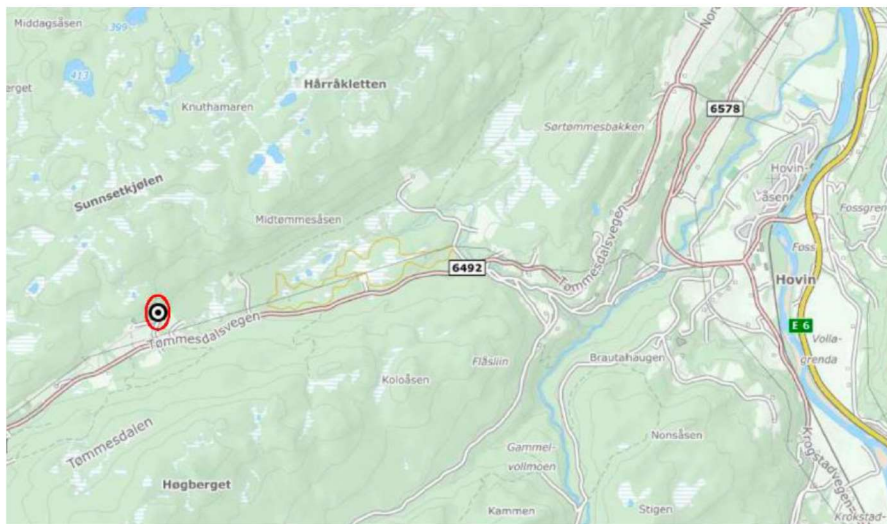
Figur 1 viser beliggenhet i Tømmesdalen markert med punkt.