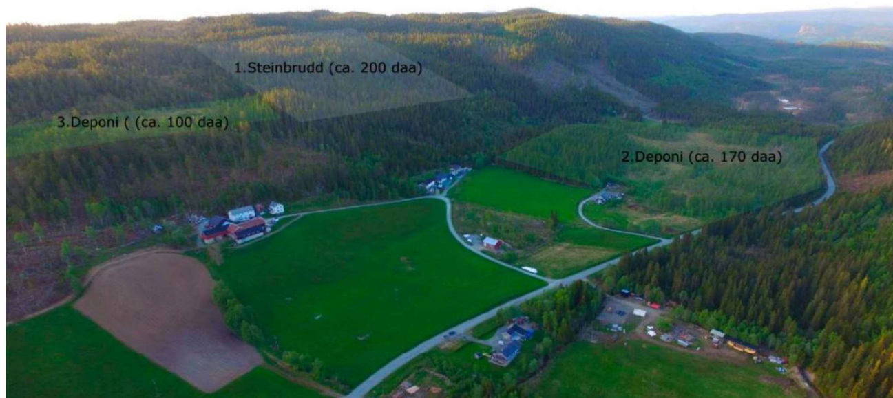
Figur 3 viser flyfoto over området og arealer for uttaksaktivitet og deponiområder.

Figur 2 viser planområdet avgrensning samt avgrensning av steinbruddet (rosa) og deponiområdene (oransje). I tillegg vises omtrentelig vegføring innenfor planområdet med svart linje.