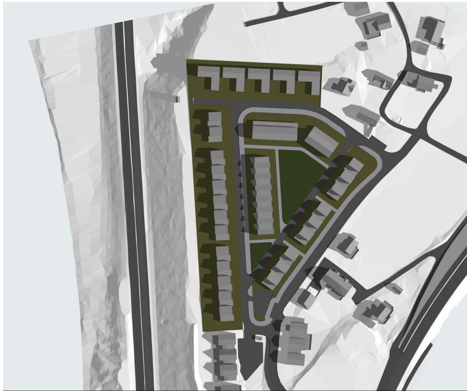
23. juni kl. 09.00