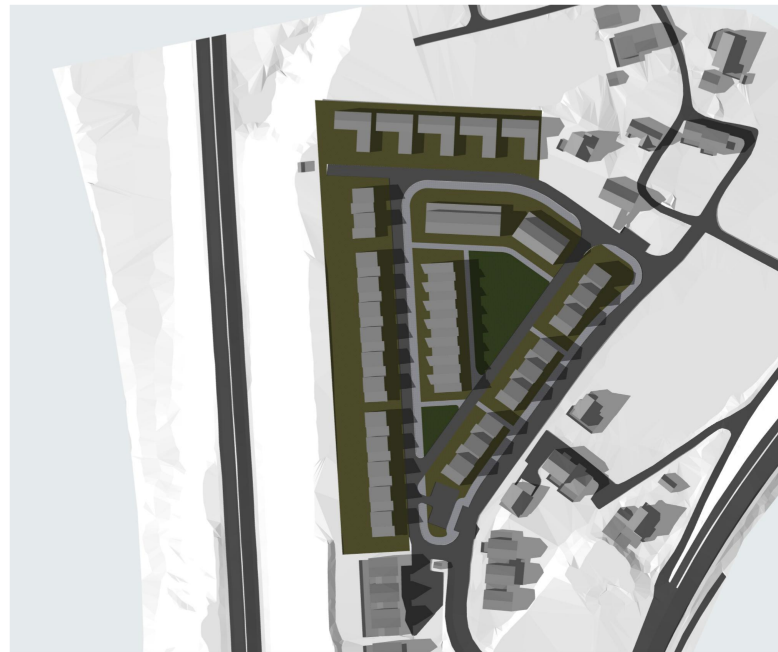
23. juni kl. 18.00