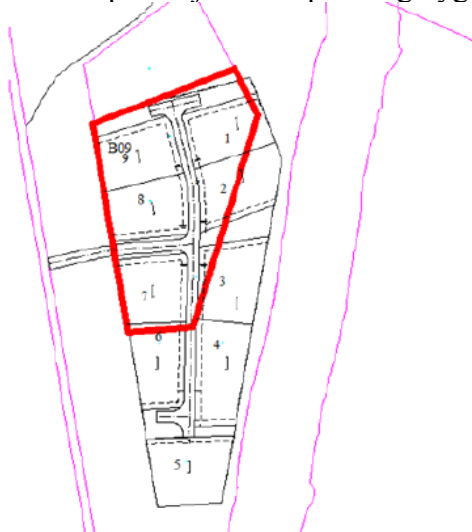
Figur 2: Rød innramming viser området som er avsatt til fremtidig boligområdet i komunedelplanen for sentrum I tomtedelingsplanen for B09 er boligområdet betydelig utvidet (svart strek).

Planstatus per i dag er at omsøkte areal ligger innenfor et område som er avsatt til landbruks-, natur- og friluftsmål samt reindrift (LNFR) jf. kommuneplanens arealdel. Omsøkte tiltak krever dispensasjon etter plan- og bygningslovens § 19-2.